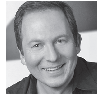
Moderation: Thorsten Otto